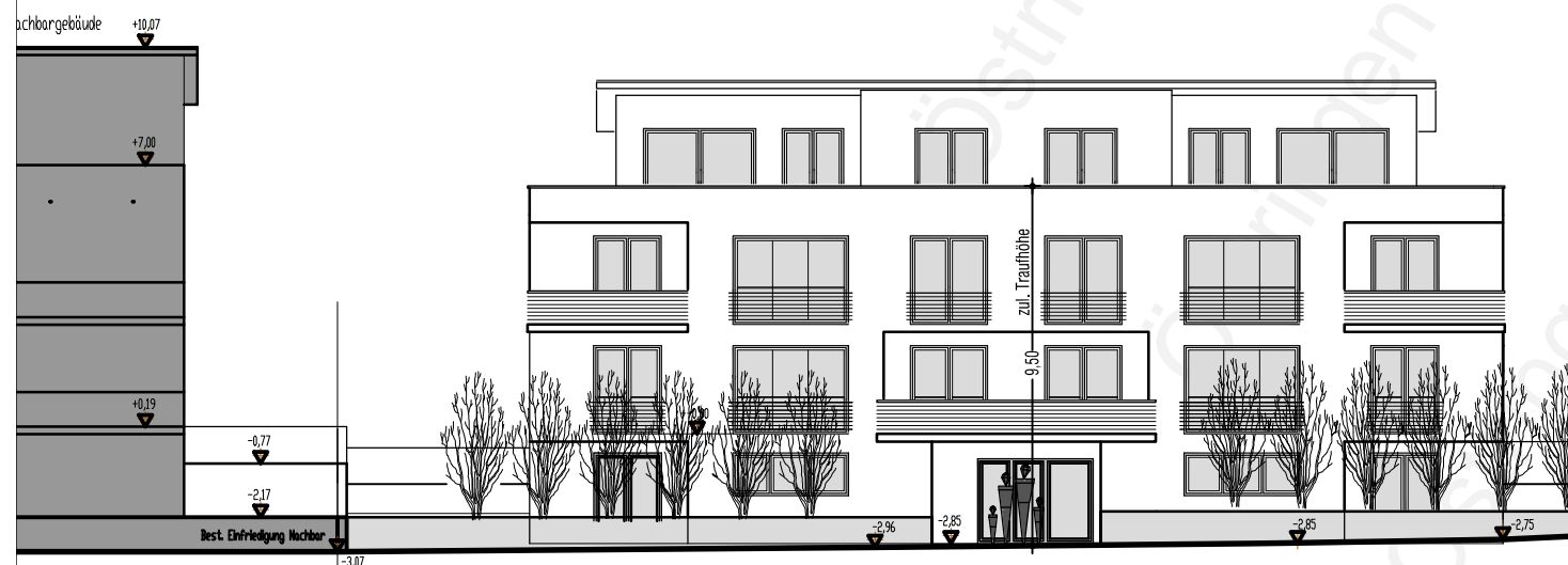
Ansicht von Südosten