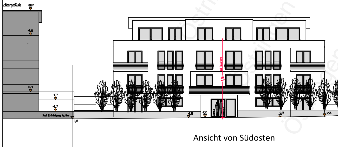
Ansicht von Südosten